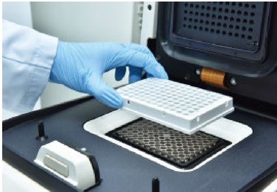
快速精準的核酸檢測讓出口更具競爭力