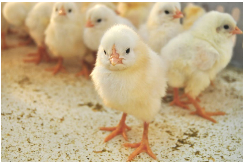
血清抗體陰性胚蛋及雛雞