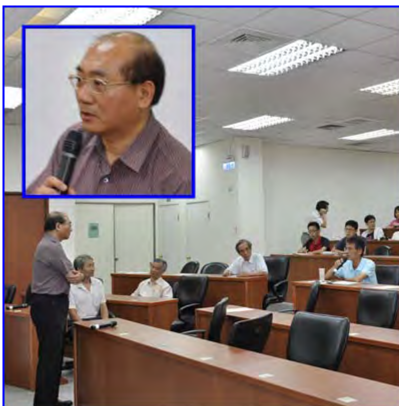
圖、邀請美國疾病管制局謝文儒博士專題演講，並與會人員充分討論。

本所於 102 年 7 月 16 日邀請美國疾病管制局謝文儒博士在獸醫試驗中心 1 樓會議室專題演講「流感那些事兒 (A Sketch of Influenza)」，並針對病毒感染有時會發生噬血反應 (hemophagocytosis) 進行解說，該反應是一種自體免疫辨識感染細胞進而進行吞噬作用，並會造成細胞激素 (cytokines) 之釋放及對全身細胞造成反應，暑期實習生、獸醫相關人員及本所同仁共計 44 人與會。