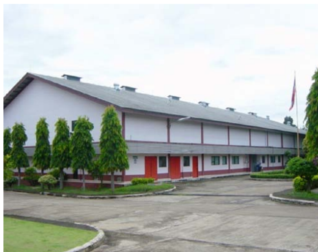
圖 2、BVB 口蹄疫疫苗 2 廠外觀，本廠以生產豬隻之口蹄疫疫苗為主。