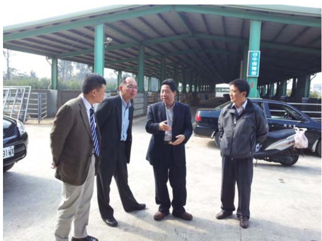
圖 1、赴金門縣畜產試驗所種牛場參訪。人員由左而右依序為日本國家動物衛生研究所菅野徹博士與坂本研一博士、本所蔡向榮所長、金門縣畜產試驗所文水成所長。