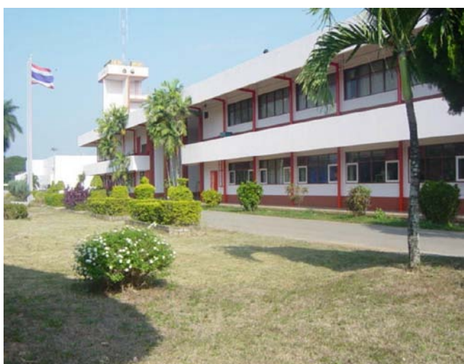
圖 1、BVB 口蹄疫疫苗 1 廠外觀，本廠以生產牛羊等反芻動物之口蹄疫疫苗為主。