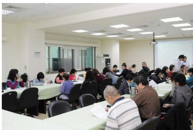
圖 2、邀請相關實驗室及秘書室人員一同討論。