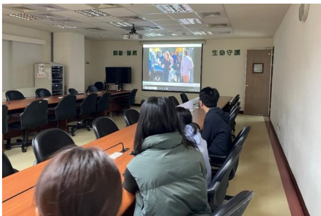
113 年 3 月 1 日辦理性別平等—「她有話要說」影片賞析。

暢銷書籍，敘述兩位如何以記者的力量，從調查受害者、反覆求證至揭發好萊塢知名製作人多起性侵、性騷擾案件，細膩地呈現女性在家與職場上的多元角色及新聞業的運作過程，鼓勵女性打破沉默為自己發聲。透過影片讓同仁了解女性在家與職場的多重角色，及其面臨不平等體制與待遇之困難。當日共計 44 人參訓。(人事室)