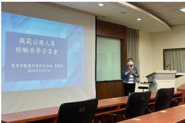
113年3月27日辦理模範公務人員經驗共學分享會。