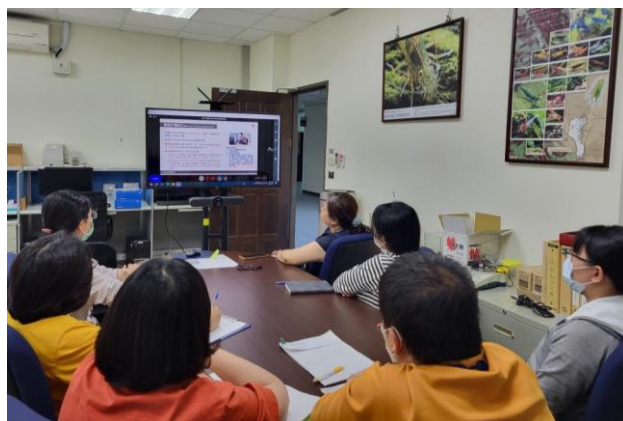
屏東水生實驗室遠端視訊連線情形。