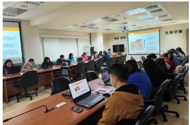
本所各組室及檢定中心同仁踴躍參加。

繼 113 年 2 月 20 日邀請國家高速網路與計算中心莊朝鈞博士發表「如何讓大型語言模型 LLMs 模型回答你覺得合理的答案 (LLMs 向量資料庫)」專題演講後，為了讓同仁能進一步實際應用。因此於 3 月 21 日再度邀請莊博士舉行初階實作課程的教育訓練，教導同仁如何利用免費的軟體，在自己電腦執行本地端大型語言模型 (Local LLMs)，接續應用自己電腦對外提供大型語言模型服務 (Local API)，進一步在自己電腦執行基於 RAG 方案的專屬私有知識庫，並註冊 OPENAI API。同仁按部就班地依照莊博士的講解步驟，成功地在自己的電腦執行大型語言模型，並建立基於 RAG 方案的專屬私有知識庫。希望藉由本項實習，讓同仁有更多實作經驗，以協助同仁資料分析及計畫研提。(生物組)