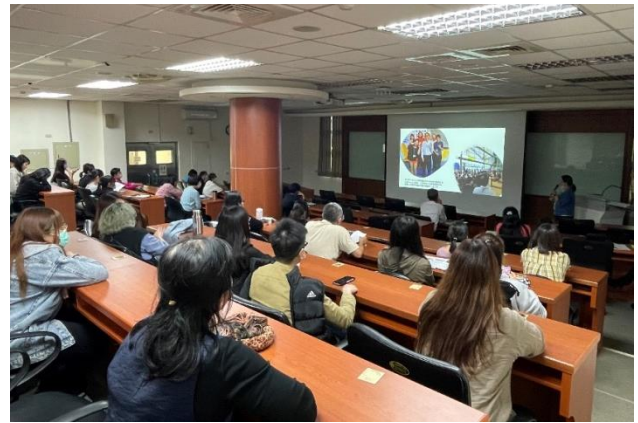
113年3月27日模範公務人員經驗共學分享會演講情形。