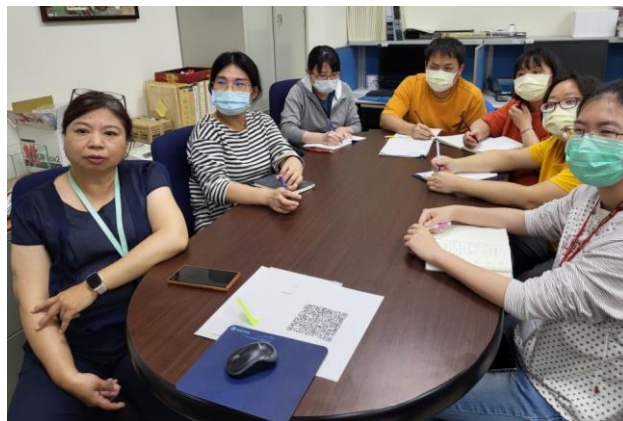
屏東水生實驗室同仁聚精會神聆聽。