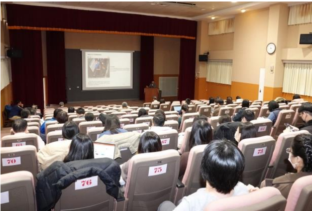
聽眾專心聆聽演講。