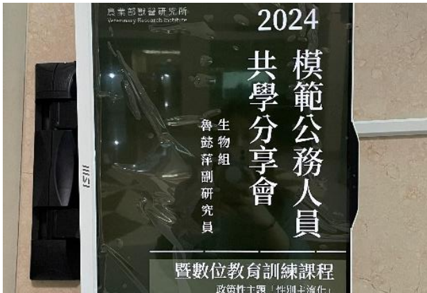
113年3月27日模範公務人員經驗共學分享會海報。