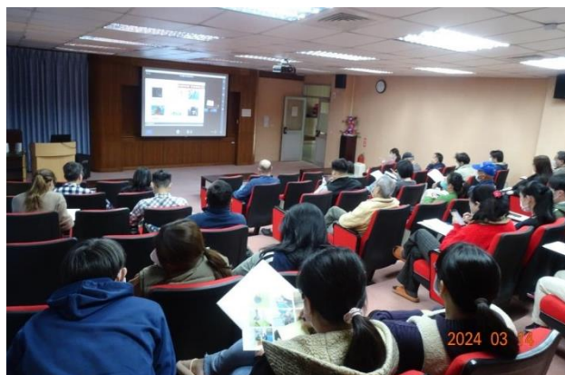
檢定中心遠端視訊連線情形。