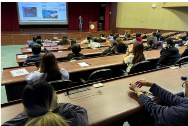
物聯網興起吸引大家認真聽講。