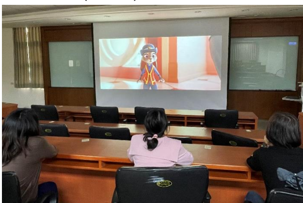
113年3月27日辦理性別平等—「她有話要說」影片賞析。

113年3月27日辦理性別教育—「動物方程式」影片賞析。在片中的動物世界，所有的動物們已經因為演化，克服了兇殘殺戮 / 躲藏逃跑的本性，並且承諾不互相傷害，甚至在一座大都會裡共同分工、和諧共處。然而在多元美好的環境結構裡，背後隱憂才是影片真正要探討之處，片中包含了對現實世界裡價值觀偏見、刻板印象、種族歧視等議題的隱喻，尤其是凸顯出性別平等課題的重要性。透過影片可以使同仁對於種族歧視、性別意識等課題有更深刻的省思。當日共計69人參訓。(人事室)