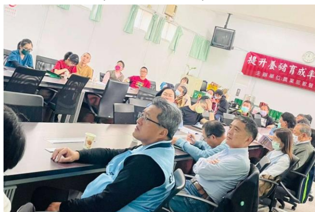
與會機關代表、農民及獸醫師踴躍參與。

與會代表、農民與獸醫師踴躍參與並專心聆聽課程，會後也積極交流地方養豬產業現況及防疫歷程等資訊，相信此次座談會讓參與者滿載收穫，加深各界對養豬產業發展的共同願景！(新興傳染病組)