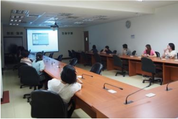
性別主流化-「性別主流化 CEDAW 施行法-暫行特別措施與案例」數位課程。