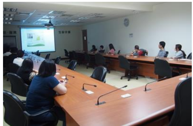
行政中立課程-「行政中立理論與實務」數位學習。

109 年 9 月 17 日辦理「全民國防教育-最黑暗的時刻」影片賞析，透過此課程使同仁體認國家安全法制與危機管理機制，體認國家安全的重要性，強化國防與經濟、文化、心理的關連，讓同仁理解國防事務其實與生活息息相關，加強全民國防意識，增進對國家的認同，共計 36 人參加。(人事室)