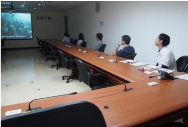
全民國防教育-「最黑暗的時刻」影片賞析。