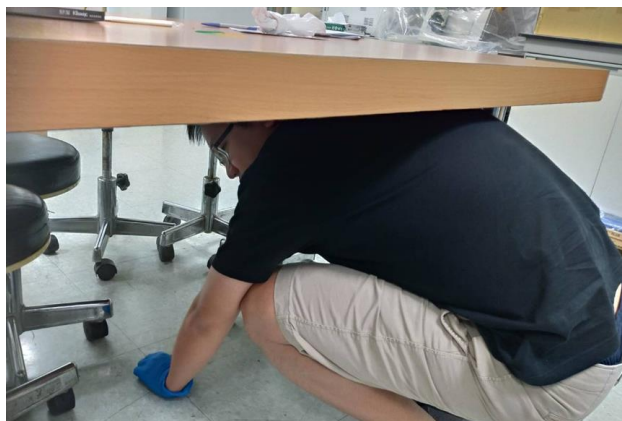
實驗室中就地避難。