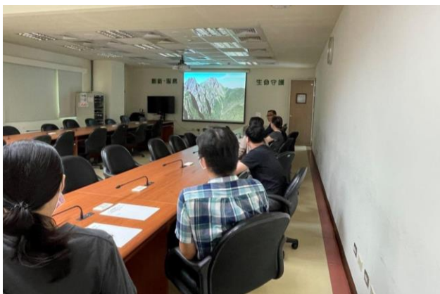
112 年 8 月 28 日環境教育及多元族群文化課程。

本所訂於 112 年 8 月 28 日(星期一)辦理環境教育 - 「看見台灣」影片賞析及多元族群文化 - 認識日常生活中的「隱微」歧視。環境教育 - 「看見台灣」全片以空拍方式記錄台灣美麗的地理人文，也記錄了因為過度開發而變得千瘡百孔的土地。觀賞影片讓同仁們意識到環境保護的重要性。多元族群文化 - 認識日常生活中的「隱微」歧視講解歧視的定義及日常生活中無意識產生的歧視言行，又應該如何避產生歧視行為。有助同仁們了解如何尊重不同族群及文化。當日共計有 77 人參加。(人事室)