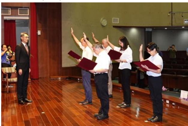
派任主管進行宣誓。