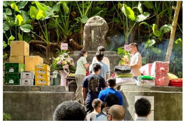
同仁輪流獻香致意。