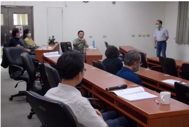
與會學員於綜合討論中踴躍發表建議。