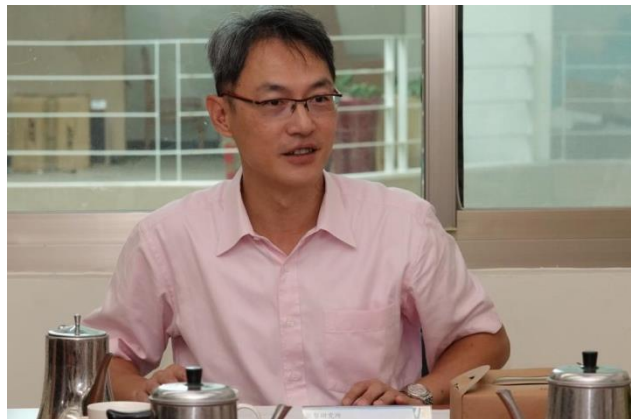
本梯次暑期實習結訓式由鄧明中所長親自主持。