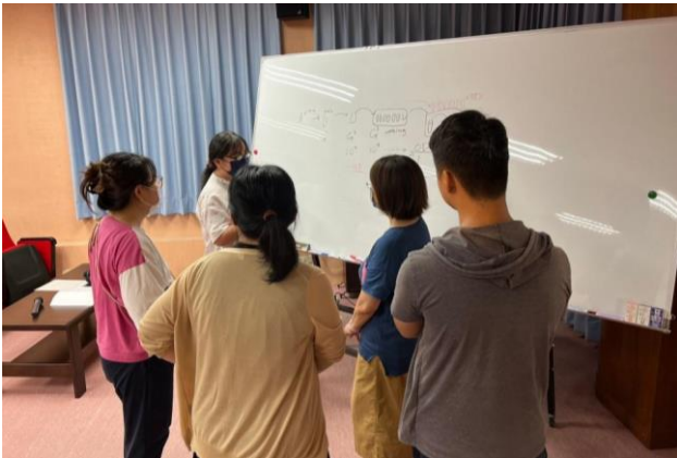
課後學員踴躍與講師互動討論。