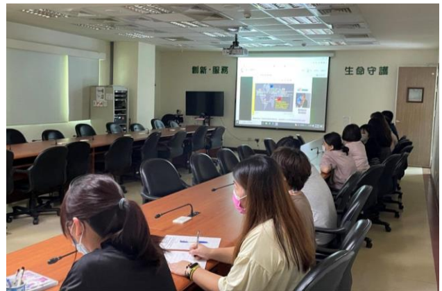
112 年 8 月 22 日當前政府重大政策及性別主流化教育課程。

本所於 112 年 8 月 22 日(星期二)辦理當前政府重大政策 - 臺灣數位轉型與資安發展及性別主流化 - 「兩個爸爸」影片賞析。當前政府重大政策 - 臺灣數位轉型與資安發展介紹於 111 年成立的數位發展部，包括該部任務、組織架構、以及推動主軸等。有助同仁們了解政府推動數位發展的相關政策。性別主流化 - 「兩個爸爸」影片賞析以幽默詼諧的風格描寫一對同性伴侶面對突然闖入他們生活的男孩，從原本抗拒、不知所到漸漸對彼此打開心房的情感轉變，建立起家人之間的關係。有助同仁們了解多元性別組成的家庭型態。當日共計有 70 人參加。(人事室)