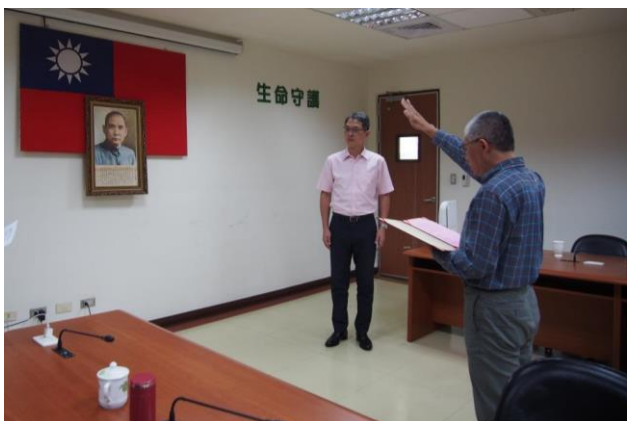
派任主管進行宣誓