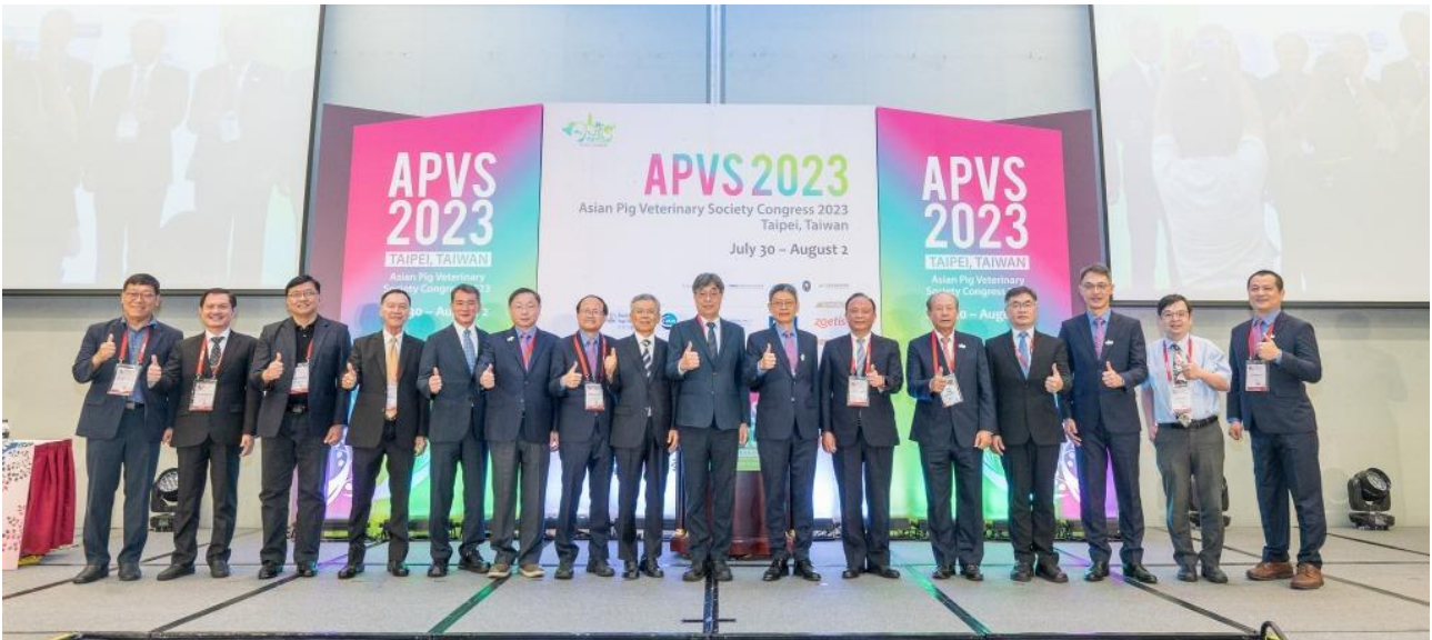
農業部陳駿季次長(右八)、本屆 APVS 年會邱明堂主席(右七)、中央畜產會林聰賢董事長(右六)、本屆 APVS 年會莊寬裕副主席(右五)、農業部動植物防疫檢疫署邱垂章署長(右四)、本所鄧明中所長(右三)、中華民國獸醫師公會全國聯合會理事長譚大倫理事長(右二)、本屆 APVS 年會林昭男秘書長(右一)及各國與會專家等來賓於年會開幕式合影。