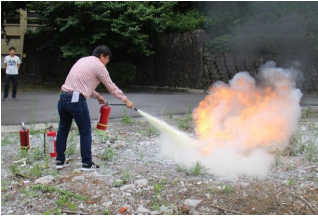
同仁實際操作滅火器實施滅火。