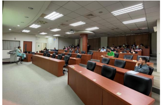
「兩公約人權教育」及「消除對婦女一切歧視公約(CEDAW)」專題講座。