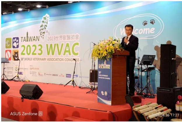
農委會陳吉仲主委蒞臨大會致詞勉勵。