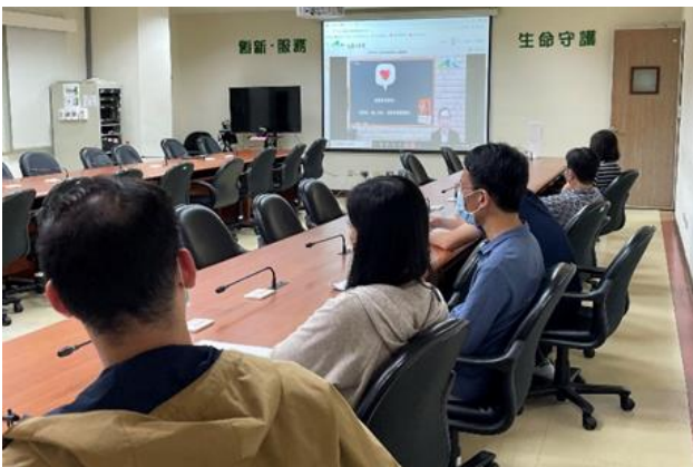
112 年度每月一書導讀：「自我發展與人文關懷領域」&「公共政策與管理知能領域」學習課程。

112 年 5 月 19 日辦理本所 112 年度每月一書導讀：「自我發展與人文關懷領域」&「公共政策與管理知能領域」學習課程，透過講師的導讀解說，瞭解 112 年度每月一書共計 12 本書籍分別為不同領域之內容，有助同仁們體會閱讀樂趣，培養閱讀習慣。共計 49 人參訓。(人事室)