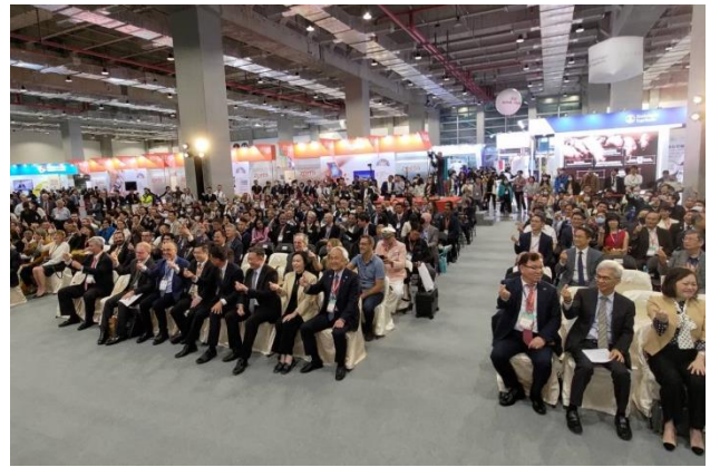
26日開幕儀式與會的獸醫師來自20幾個國家，國內外講師及獸醫師逾2500位參加，其中國外獸醫講師近80名，國外的獸醫師約600人，來台共襄盛舉。