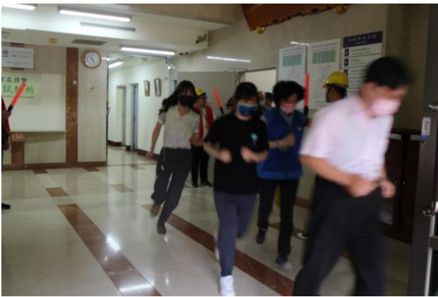
同仁依避難引導班指示迅速逃生。