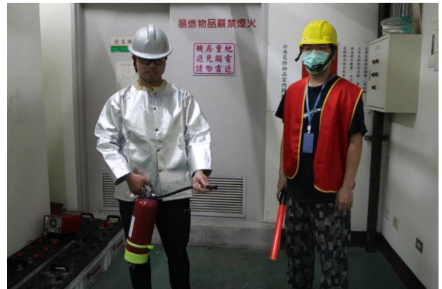
安全防護班及滅火班發電機房警戒。