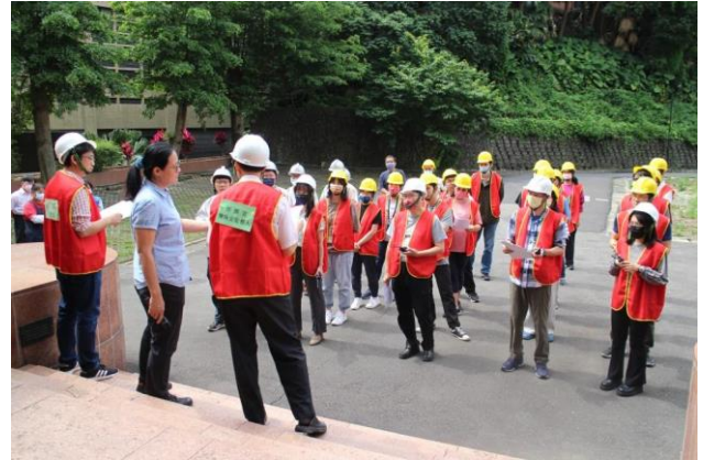
指揮官向同仁說明演練要旨及注意事項。

本次演練作為本所避難搶救作業及日後演練改進依據；並將消防演練紀錄提報新北市政府消防局第三大隊淡水分隊核備。(秘書室/事務)