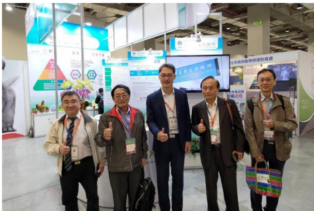
鄧明中所長偕同許聰文副所長、黃建元主任秘書與前農業委員會黃國青副主任委員及前彰化縣政府農業處郭丑哲處長等貴賓合影。