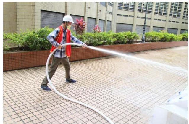
同仁至消防栓箱拉起水帶模擬滅火。