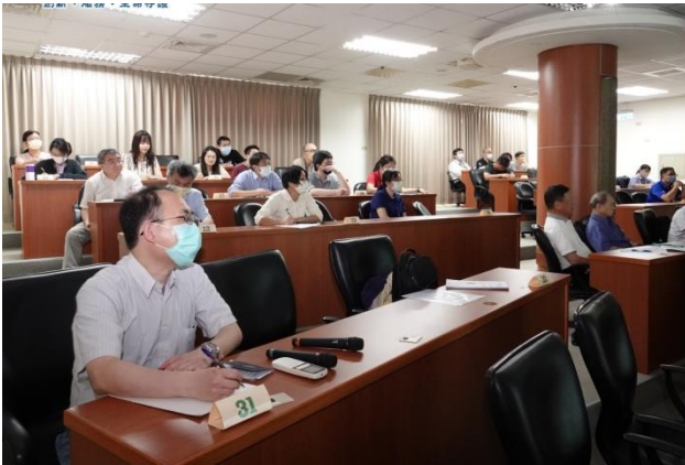
出席人員認真聆聽專題演講。