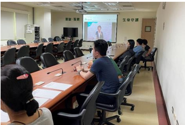
112 年 5 月 30 日辦理本所 112 年度每月一書導讀：「華頓商學院的情緒談判課」&「登一座人文的山」學習課程。

112 年 5 月 30 日辦理本所 112 年度每月一書導讀：「華頓商學院的情緒談判課」&「登一座人文的山」學習課程，透過講師的導讀解說，有助同仁們瞭解情緒與談判的關係，如何從生活中應用，並以人文角度理解人類文明與自然環境的關係。共計 58 人參訓。 (人事室)