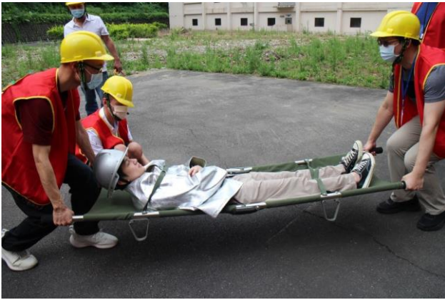
救護班模擬受傷人員救護。