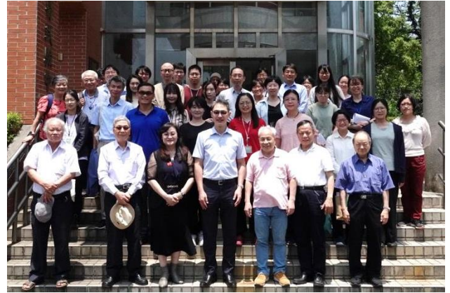
專題演講結束後與會人員與張永富教授合影。

業務及試驗研究方向之討論。張永富教授除分享自身相關研究經驗，對於實驗設計及未來發展方向提供許多建言，並期勉所內同仁前往世界各國優良實驗室參訪及進行培訓與試驗研究。(豬瘟研究組)