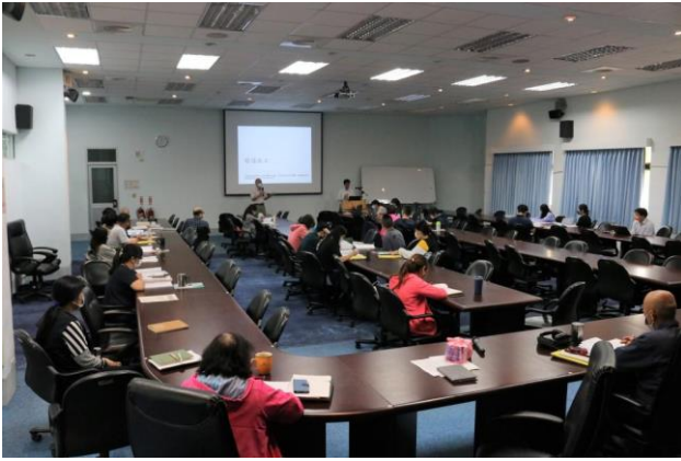
動物用藥品產業人員教育訓練班2日現場共157人次實體參與課程。