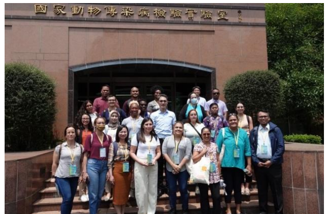
所有外賓在國家動物傳染病檢驗實驗室合照。