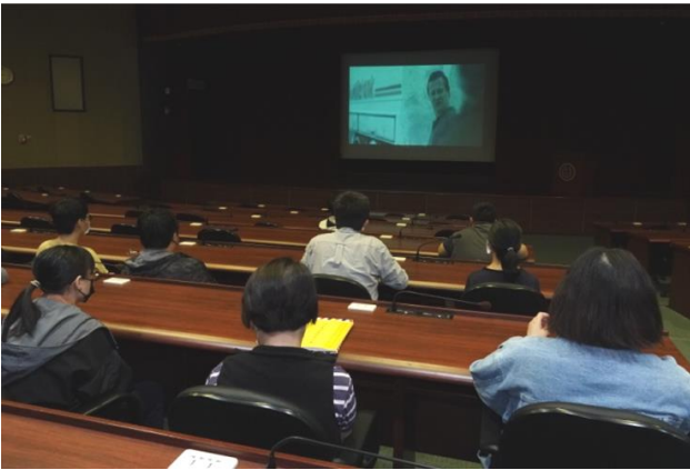
環境教育 - 「奪命隧道」影片賞析。

112 年 4 月 14 日辦理本所環境教育 - 「奪命隧道」影片賞析。影片改編自發生在挪威的真實事件，講述在山區隧道內發生油罐車自撞事故，失事卡車起火爆炸，導致許多民眾被困在黑暗狹窄的隧道裡頭，大家只能遵循標準程序、經驗及直覺做出判斷，自救逃生。透過影片讓同仁學習隧道中若是意外事故的危險性，保持冷靜自救的重要性。共計 134 人參訓。(人事室)