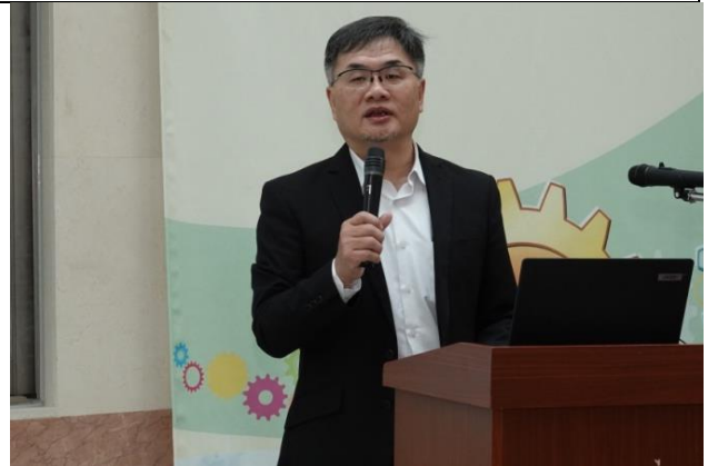
行政院農業委員會動植物防疫檢疫局局長邱垂章致詞。

112年4月14日辦理本所118週年所慶。全所同仁齊聚在綜合研究大樓交誼廳，由各組組長發表業務成果，隨後大家一同餐敘並辦理慶生活動，現場準備了生日蛋糕，為家畜衛生試驗所及同仁們慶祝生日，也邀請了長官貴賓及退休聯誼會成員到場參與。期間彼此充分互動交流情誼、凝聚向心力，總計約200人與會。(人事室)