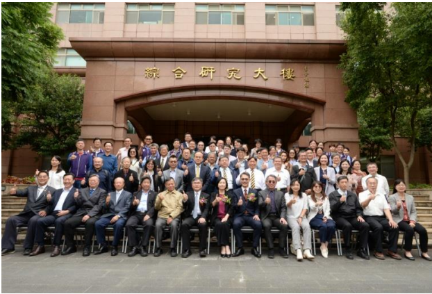
觀禮貴賓及本所同仁合影留念。