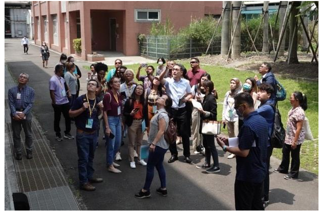
帶領與會人員參觀本所。