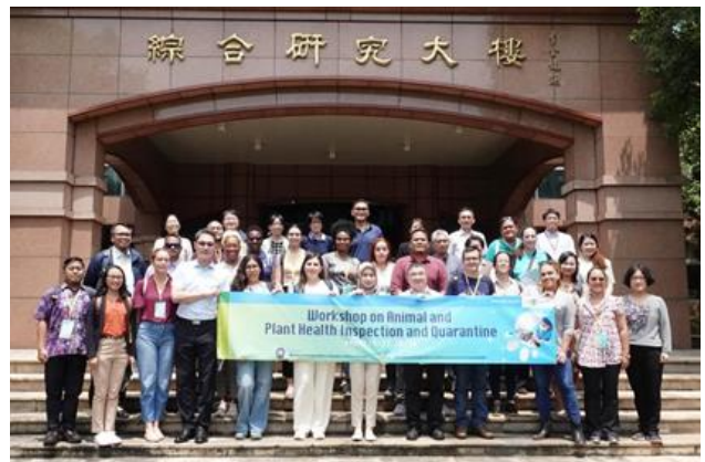
本所與會人員與動植物防檢疫技術研習班人員大合照。