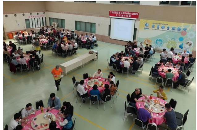
本所 118 週年所慶全體同仁餐敘。