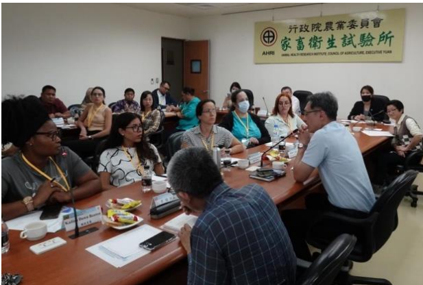
與會人員會中熱烈討論。