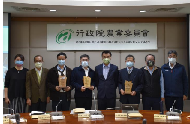
農委會陳主委、黃副主委及本所所長、各單位主管大合照。