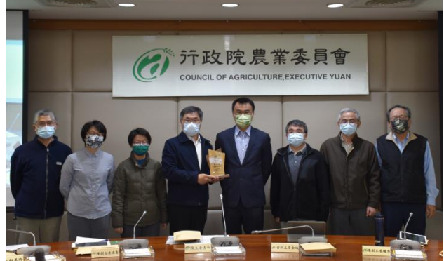
農委會陳主委、黃副主委及本所所長、副所長、分所長及各組組長大合照。