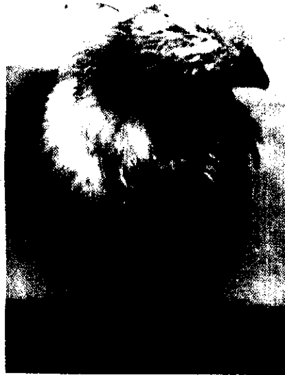
Fig.1. Swelling in Left Patella Joint