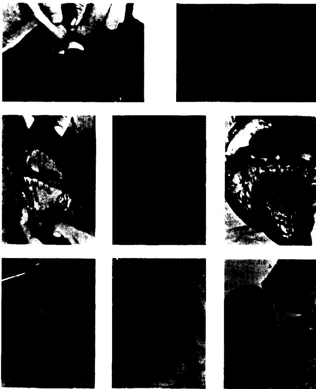
圖3 蕨中毒牛隻之病理變化，以各器官及組織之出血為主徵，呈現嚴重之 Haemorrhagic diathesis 病變。(上排為眼結膜，腹股部皮下出血，中排為口腔，腹腔臟器，心外膜之出血病變，下排為大量血樣心囊液，膀胱血瘤樣病變及其組織病變)。