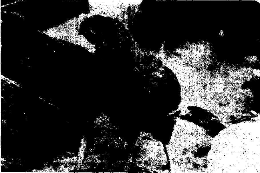
圖一、開口呼吸及眼窩下實腫大病雞