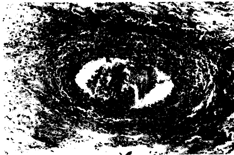
圖三、氣管內接種牛隻、皮膚片可見血管炎及嗜酸球性皮膚炎