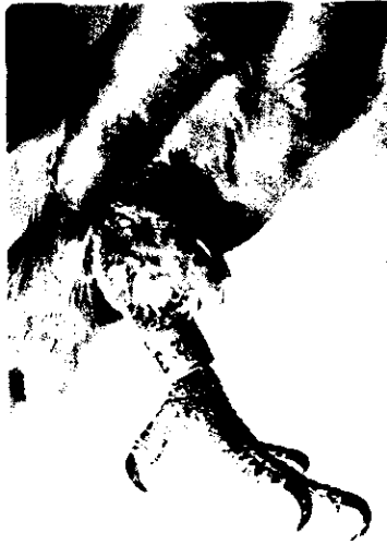
圖1 賽鴿黃瘤症，左膝關節部位皮膚上有一約 2 \times 3 \times 3 公分大之不正球形橘黃色瘤樣物。