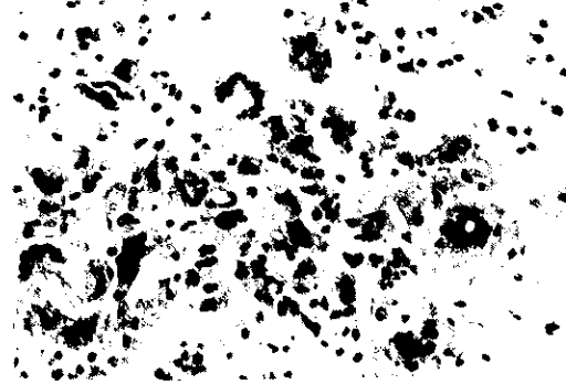
圖4 在膽固醇肉芽腫周圍浸潤的巨細胞，包括異物巨細胞（foreign body giant cells）及藍罕氏巨細胞（Langhan's giant cell）。H&E, \times 400 。

4282 mg / 100 gm) 卻遠高於正常皮下組織 的含量 (154 mg / 100 mg)。 (3) 本病例 並未檢查膽固醇在血中及患部皮下組織的含 量，但由其特異性的病理變化即應可確診為黃 瘤症。