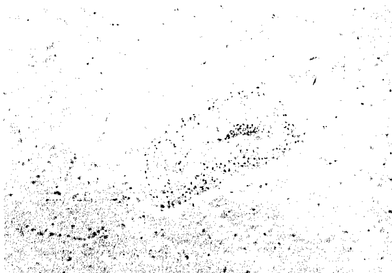
Fig. 4. Marked perivascular lymphocytic infiltration are found in the brain section of a pigeon suffering from Newcastle disease (Avian paramyxovirus type 1 infection). H & E stain. X200.

合感染情形，如表 8 所示，以麥可菌所引起之慢性呼吸器病 (CRD) 最為常見，其他如大腸菌性敗血症，馬立克病、球蟲病、內寄生蟲病感染症、雞傳染性華氏囊病、雞傳染性支氣管炎等亦是常見之合併感染症。