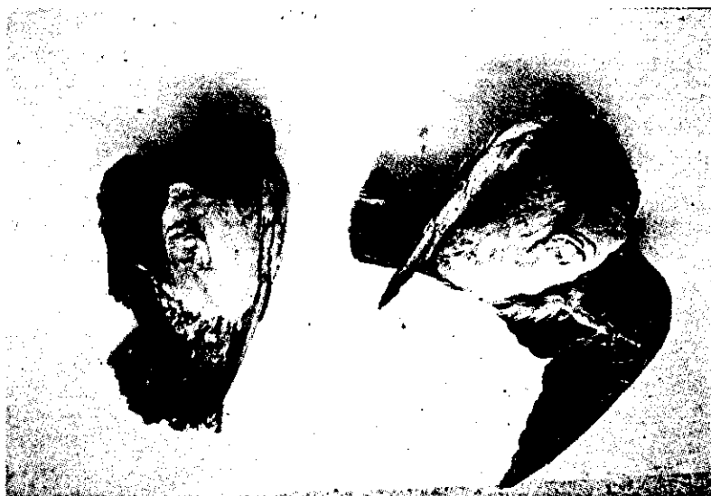
Fig. 3. Newcastle disease virus (Avian paramyxovirus type 1) infected pigeons showing diarrhea, convulsion, and paralysis.