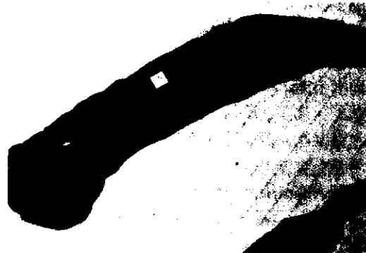
圖2 哺乳後3小時，以豬瘟疫苗接種免疫之豬隻# 5，耐過豬瘟強毒攻擊，脾臟有梗塞恢復後之黃白色纖維化病變區