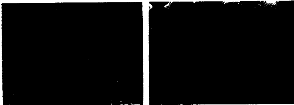
圖二 培養於 cytodex I 表面 4 天的 RK - 13 細胞 (左, 250×) , 其感染 PR 病毒 18 小時後出現之細胞變性 (CPE) (右, 250 ×)

AE-dextran 與油劑疫苗及法國疫苗等疫苗後抗體反應如表二所示。第二次注射係在第一次免疫後兩週於採血後行之。免疫注射微粒子培養製成之 DEAE-dextran 及油劑疫苗之小