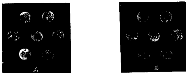
圖2 兩種抗原對受檢馬血清檢驗之非特異性沉澱線比較