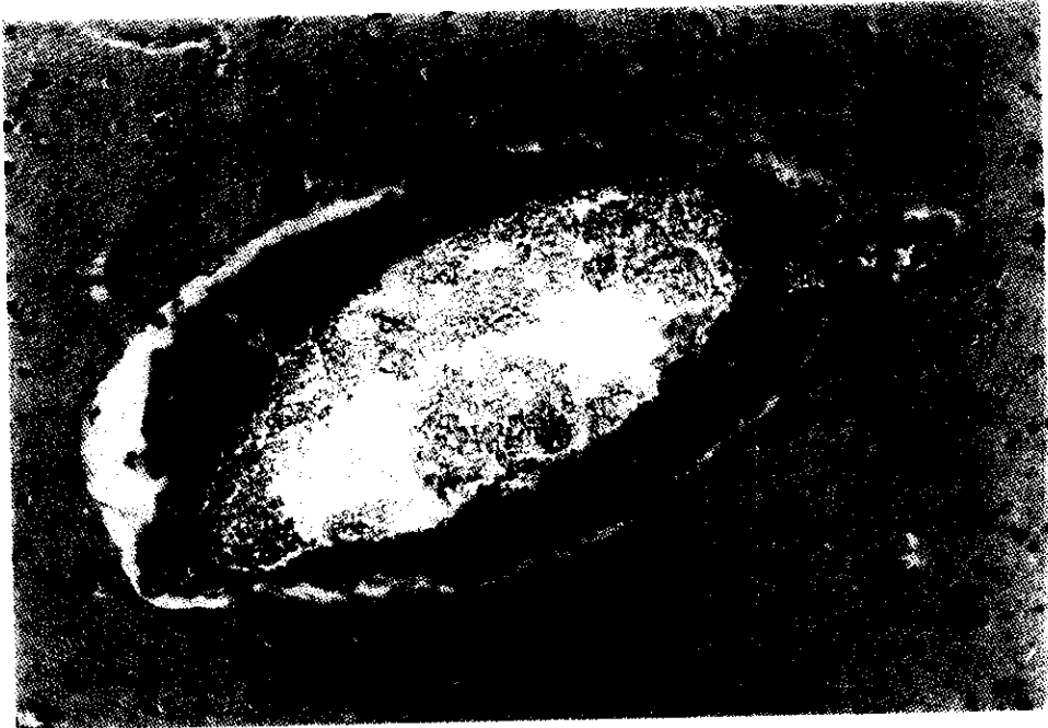
圖 1 台南馬病例大腦血管有嚴重充血及淋巴球圍管現象 ( X400 )