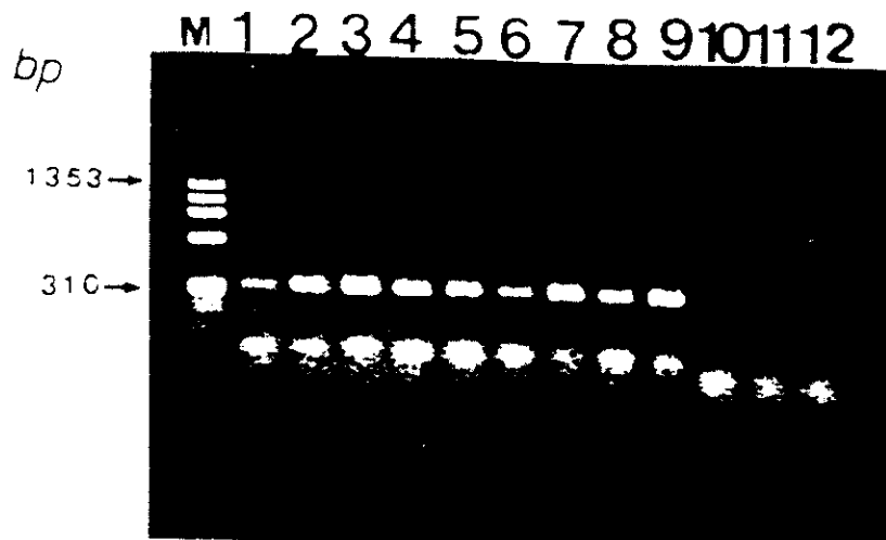
圖 1. 引子 (Primer 1, 2) 對新城雞病病毒與其他病毒株之特異性試驗。在 Mupid-2 中 100V 30 分鐘電泳分析。結果顯示 Primer 1~2 對所有新城雞病病毒均能產生特異性聚合酶鏈反應產物，但對 IBD, MD 及 ILT 等病毒株均不產生聚合酶鏈反應產物。