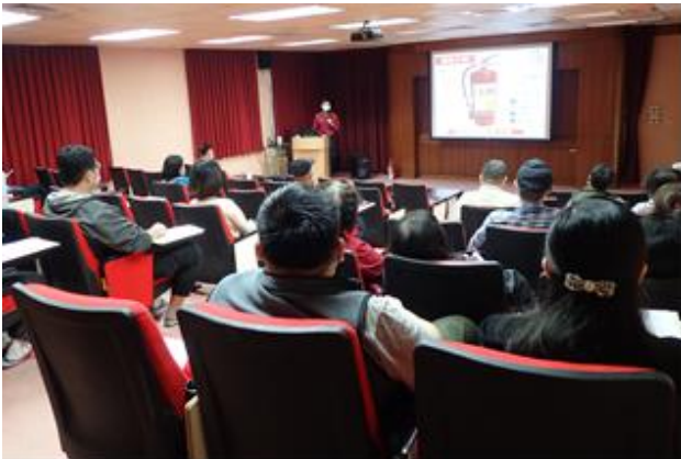
分所同仁聽講情形。