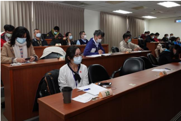
出席同仁專注聆聽謝博士演講。