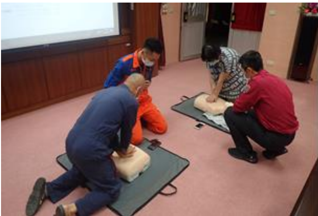
分所同仁實地操作 CPR。