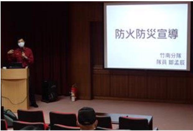
講師進行防火宣導。