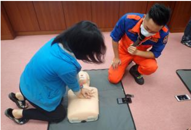
分所同仁實地操作 CPR。

並實地演練心肺復甦術(CPR)，期望在危急時，能及時救人一命。本次參與演練人數共計 48 人，演練過程順利圓滿。(檢定分所)