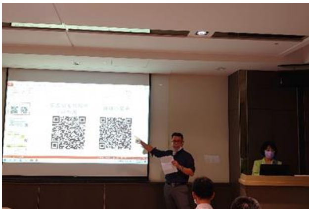
講師介紹「豬豬小幫手」LINE 平台進行宣導。