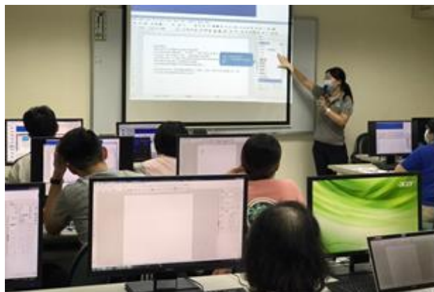
講師介紹 ODF 文件製作。