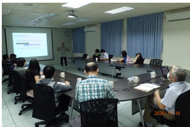
與會同仁專心聆聽演講內容。