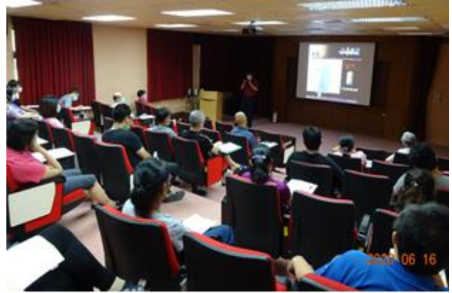
分所同仁聽講情形。