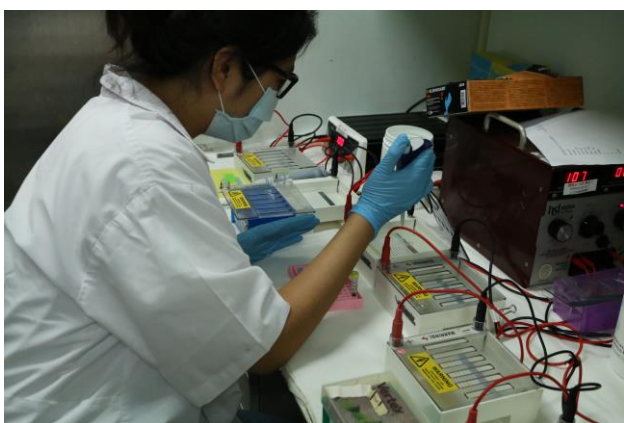
學員進行電泳樣品填樣。