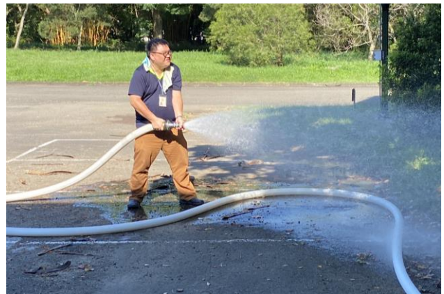
分所同仁實地操作消防栓。