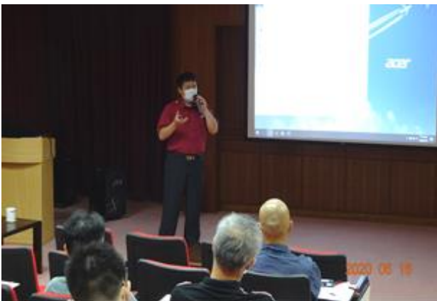
講師進行防火宣導。