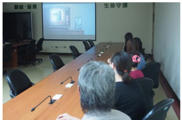
性別主流課程-「勝負反手拍」影片賞析。

本所於 109 年 6 月 11 日辦理性別主流課程-「勝負反手拍」影片賞析，此片不單單是一部運動電影，它展示了多元的性別面相，而不僅是「兩性」平權而已，情慾的所有都被世俗接受，多元才是真正的多元，愛才是真正的愛，人才能夠不再偽裝，真正坦然地做自己，放膽且放肆地去實踐愛的無限可能，藉由此課程使同仁了解實質平等，是在同一個環境之下，考量特定族群與一般人的差異，共計 83 人參加。(人事室)