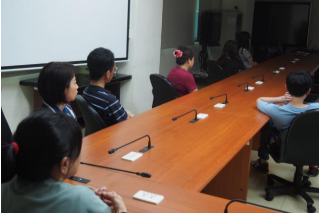
性別主流課程-「勝負反手拍」影片賞析。