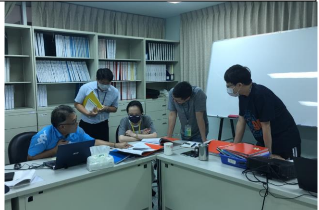
評鑑過程資料審視及問題應答。