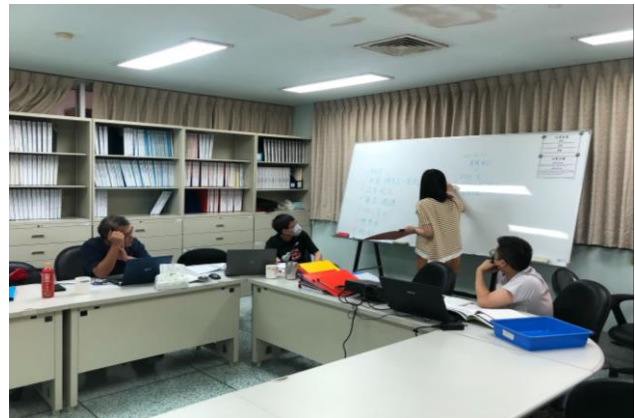
實驗室人員說明現行管理與執行。