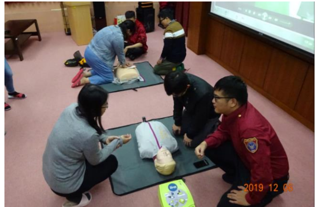
分所同仁實地操作 CPR 及 AED。