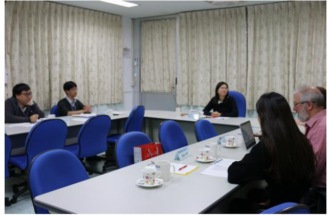
與生物藥品檢定研究系討論疫苗檢驗技術。