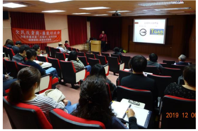
分所同仁聽講情形。