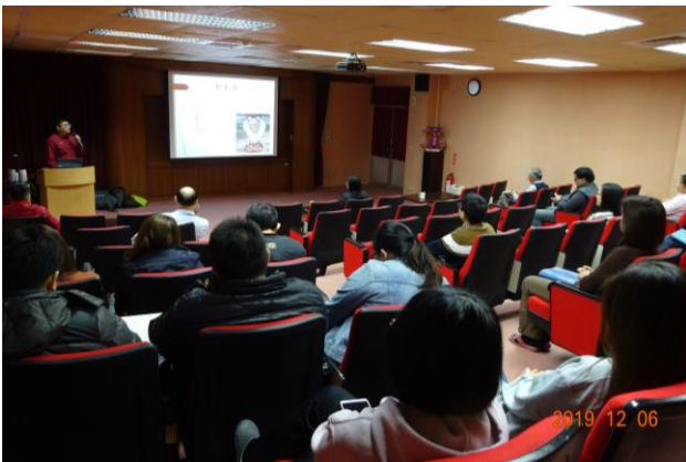
講師進行防火宣導。