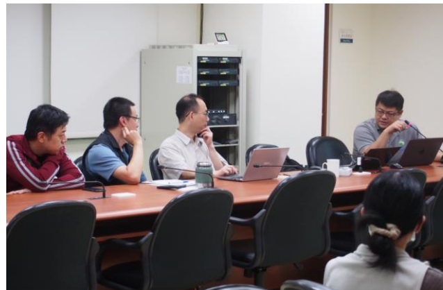
洪經理與本所同仁討論熱絡。