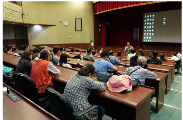
酪農協會代表開場致詞。

該會安排產業相關單位進行政策說明與政令宣導，本所予以安排場地並派員進行業務簡報。本次參訪及出席會議人數約 70 人，於本所綜合研究大樓國際會議廳進行，並於會後至豬瘟研究組參訪，活動圓滿順利完成。(疫學研究組技輔室)