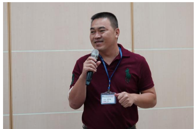
參訓學員自我介紹。