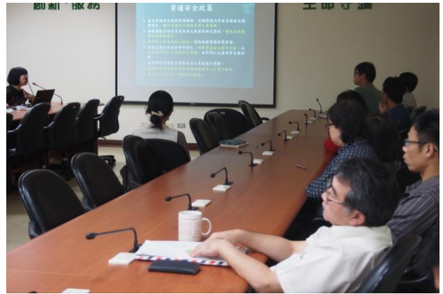
施進票副研究員進行介紹本所資安維護計畫內容。