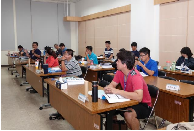
學員於課程中踴躍提問討論。