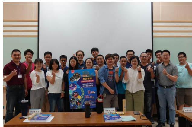
農民學院開訓合影。