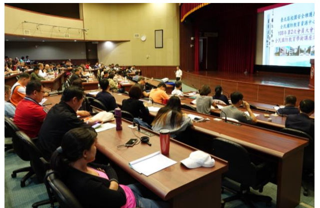
來自各大專院校教官與會情形。