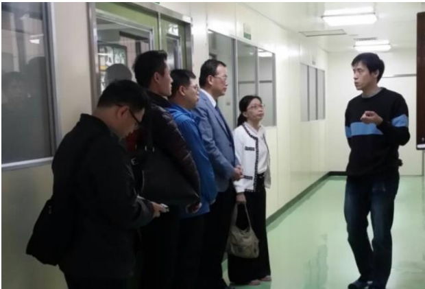
文上賢主任及教育部專員等至製劑組參訪。