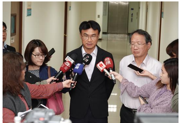
陳吉仲主任委員偕黃金城副主任委員接受媒體訪問，就本次座談會議題進行說明。