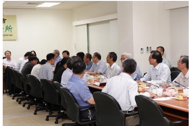
現場與會專家討論熱烈並給予多項建議。