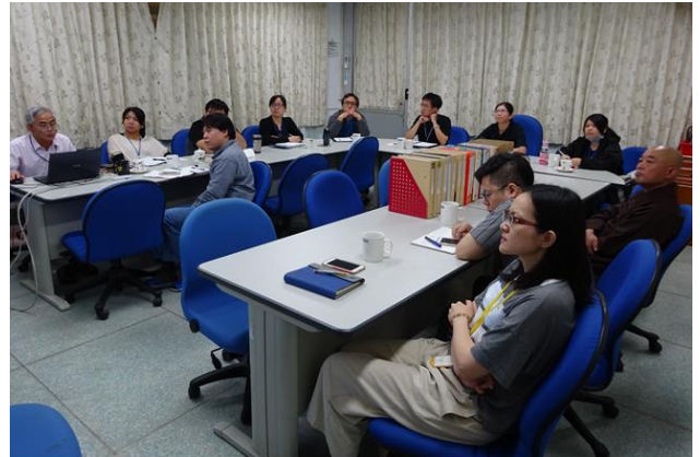
108 年 IACUC 外部查核會議進行工作簡報。