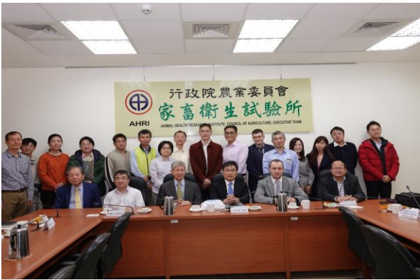
本次座談會議出席人員合影。