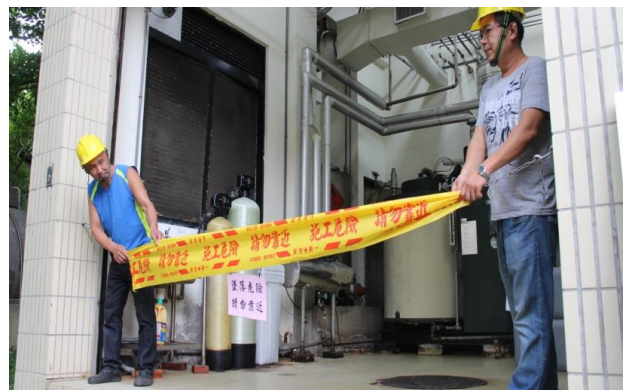
演練時同仁拉起封鎖線，隔離現場避免其他人員誤闖。