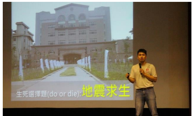
解說地震時掩護動作及演練之會場一隅。