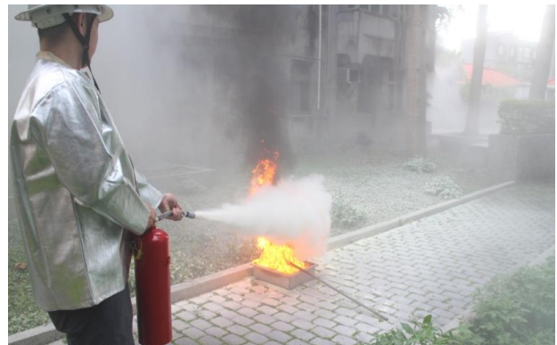
同仁進行油盤滅火實地演練。