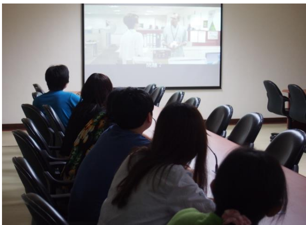
輝煌年代影片賞析。

本所於 107 年 5 月 23 日辦理多元族群文化-「輝煌年代」影片賞析，這是一部跨越種族界限的電影。一個不被看好的球隊突破逆境，拿下最終的勝利，讓人感到熱血沸騰，這部影片更發人省思的地方在於一個多元族群文化的足球隊，雖然他們有著不同的膚色說著不同的語言，但卻能撇除種族間的隔閡，凝聚出一股強大的團結力量。藉由這部影片使同仁對於種族及人權教育議題有更深一層的省思。共計 49 人參與。(人事室)